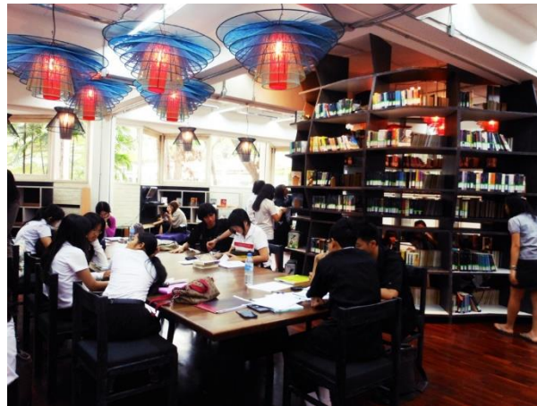
ห้องสมุดเพื่อชีวิตและสิ่งแวดล้อม หรือ KU Eco Library

มีมูลค่าหลายหมื่นบาท ดังนั้น ห้องสมุดในลักษณะนี้จึงเริ่มปรากฏให้เห็นเพิ่มขึ้นอย่างมากในรอบสิบปีที่ผ่านมา อาทิ ศูนย์สร้างสรรค์งานออกแบบ (TCDC) แหล่งค้นคว้าด้านการออกแบบและความคิดสร้างสรรค์เพื่อเพิ่มขีดความสามารถของผู้ประกอบการไทย ปัจจุบัน TCDC เปิดให้บริการแล้วทั้งที่กรุงเทพฯ และเชียงใหม่ ห้องสมุดเพื่อชีวิตและสิ่งแวดล้อมหรือKU Eco Library ซึ่งเน้นจุดประกายความคิดเรื่องสิ่งแวดล้อมและการอนุรักษ์ธรรมชาติ ด้วยการออกแบบห้องสมุดจากเศษวัสดุเหลือใช้ ห้องสมุดการท่องเที่ยว ของการท่องเที่ยวแห่งประเทศไทย ซึ่งเป็นแหล่งรวมหนังสือด้านอุตสาหกรรมท่องเที่ยวทั้งภาษาไทยและภาษาอังกฤษ เป็นต้น