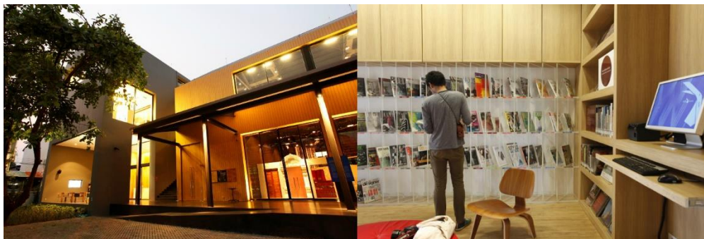
ศูนย์สร้างสรรค์งานออกแบบ (TCDC) เชียงใหม่

ในอนาคตห้องสมุดเฉพาะทางซึ่งทำหน้าที่ตอบสนองความต้องการของผู้ที่สนใจและเชี่ยวชาญเฉพาะด้านจะมีความจำเป็นต่อการพัฒนาประเทศมากขึ้น เพราะถึงแม้ว่าปัจเจกบุคคลจะสามารถแสวงหาความรู้ทั่วไปได้ด้วยตนเอง แต่การเข้าถึงความรู้เฉพาะทางด้วยตนเองยังมีต้นทุนค่อนข้างสูง เช่น หนังสือเกี่ยวกับการออกแบบบางเล่ม