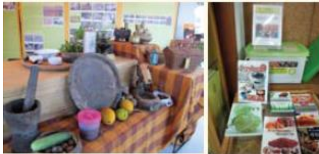
นิทรรศการเรื่องแนวกินอีสานและกล่องความรู้กินได้

อีกบทบาทหนึ่งของห้องสมุดนอกเหนือจากการส่งเสริมการอ่าน คือการกระตุ้นให้เกิดการนำความรู้ไปใช้ใน ชีวิตประจำวัน หรือส่งเสริมให้ผู้ใช้บริการได้ลงมือปฏิบัติจากประสบการณ์จริง ดังเช่นโครงการ ศูนย์ความรู้กินได้ โดยความร่วมมือระหว่าง กศน. และ สำนักงานบริหารและพัฒนาองค์ความรู้ (องค์การมหาชน) ดำเนินการปรับปรุงห้องสมุดประชาชนจังหวัดอุบลราชธานี ทั้งพื้นที่การใช้งาน สิ่งอำนวยความสะดวกพื้นฐาน และเนื้อหาสาระ เกิดเป็นโมเดลใหม่ที่เป็นตัวอย่างของการแปลงความรู้ในหนังสือให้กลายเป็นโอกาสในการสร้างหรือการพัฒนาอาชีพของชาวบ้าน ซึ่งนับเป็นการยกระดับคุณภาพชีวิตที่ดีขึ้น โดยเฉพาะอย่างยิ่งความรู้ด้านการทำมาหากินจะถูกจัดชุดบรรจุใน กล่องความรู้กินได้ เพื่อหมุนเวียนไปตามชุมชนต่างๆ ได้สะดวก เช่น เรื่องเกษตรอินทรีย์