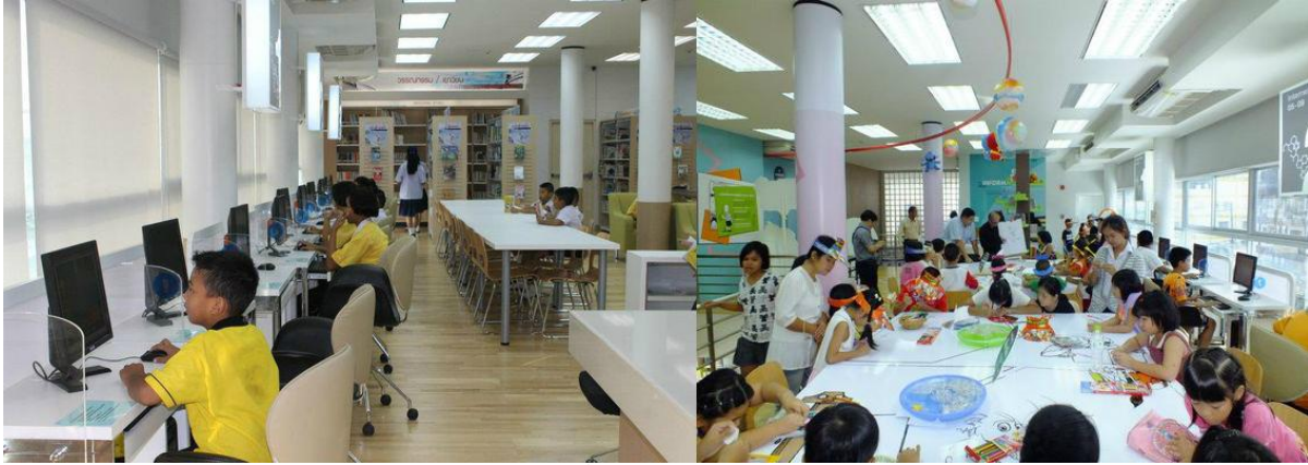
ห้องสมุดเพื่อการเรียนรู้ ห้วยขวาง

การปลูกฝังการอ่านที่ยั่งยืนคือการเริ่มต้นส่งเสริมการอ่านตั้งแต่วัยเยาว์ แต่ห้องสมุดทั่วไปอาจไม่สามารถตอบสนองความอยากอ่านของเด็กได้ เพราะเด็กมีความสนใจเรื่องราวที่แตกต่างไปจากผู้ใหญ่ ปัจจุบันห้องสมุดหลายแห่งจึงได้จัดพื้นที่การอ่านและหนังสือสำหรับเด็กไว้ด้วย นอกจากนี้ ยังมีห้องสมุดสำหรับเด็กโดยเฉพาะ อาทิ ห้องสมุดการ์ตูน ที่ห้องสมุดเพื่อการเรียนรู้ ห้วยขวาง ของกรุงเทพมหานครซึ่งเต็มไปด้วยหนังสือที่นำพาเด็กไปอยู่ในโลกแห่งจินตนาการ แม้ว่าผู้ใหญ่บางคนจะมองว่าการ์ตูนเป็นหนังสือที่ไร้สาระ แต่จริงๆ แล้วสามารถช่วยสร้างแรงบันดาลใจและปลูกฝังนิสัยรักการอ่านให้กับเด็กๆ ได้ ภายในห้องสมุดมีหนังสือการ์ตูนให้บริการกว่า 7,000 เล่ม มีห้องฉายภาพยนตร์แอนิเมชัน ห้องอ่านนิทาน มุมหนังสือการ์ตูน 3 มิติ และมีพื้นที่จัดกิจกรรม อาทิ การวาดภาพระบายสีการ์ตูน